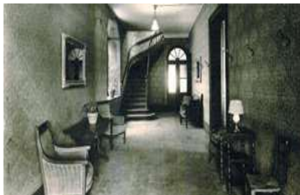
Effet du puit de lumière coté gauche