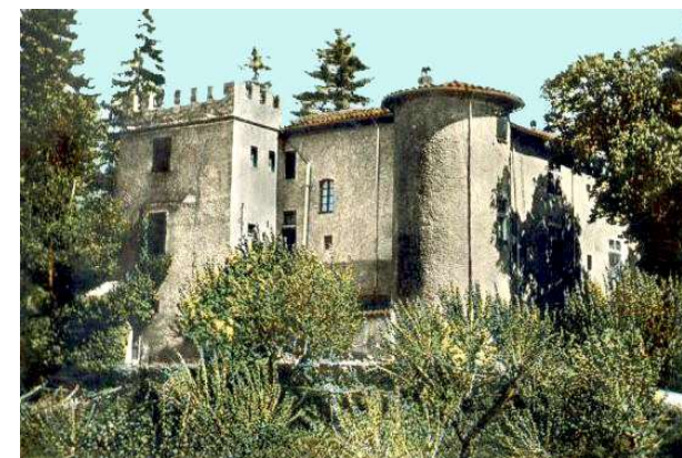
Le Château de l'hom (13 ème siècle environ)