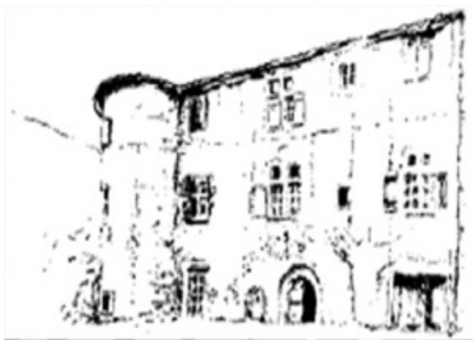
Le Château de l'hom (gravure ancienne)

C'est l'un des derniers subsistants dans la vallée borgne. Il possède une longue et riche histoire retracée depuis le 13 ème siècle et l'occupant d'alors Gervais Delhom né avant 1300, mais existait avant cette date.